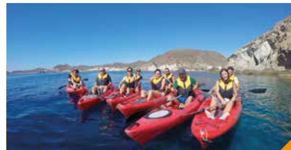
// Medialuna Aventura