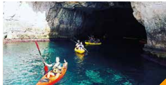
// Natural Kayak