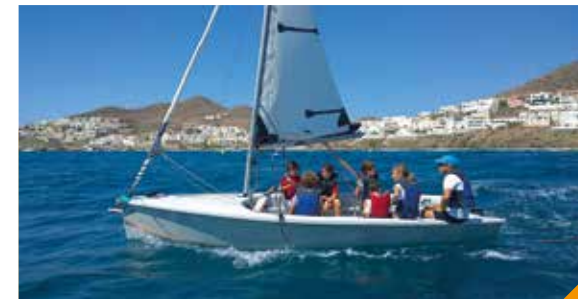
// Sailingsur School