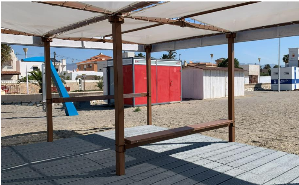
Detalle de los asientos de las zonas de sombra para la temporada 2023