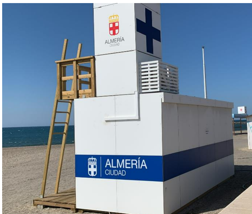
Detalle del puesto de socorrismo de Costacabana.

Este contrato se encuentra finalizado Contrato de suministro de Suministro e instalación para la reposición de dos (2) módulos de salvamento en playas en las playas de El toyo y Costacabana , cuya empresa adjudicataria es Maderas Impregnadas para el Exterior S.L.