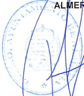
Firmado Ramón Fernández-Pacheco Monterreal

EL ALCALDE-PRESIDENTE DEL EXCMO. AYUNTAMIENTO DE ALMERIA